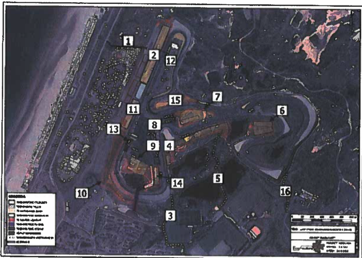
Figuur 2. Luchtfoto 2018 onderzoekslocaties 1 tot 16.

De aanpassingen die aan het circuit plaats gaan vinden bestaan uit de volgende werkzaamheden: